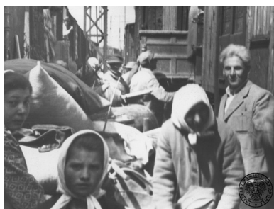
Przesiedleńcy na jednej ze stacji kolejowych. Fotografia z albumu

Przesiedlenia organizowane przez władze komunistyczne miały na celu zaludnienie ziem nowego państwa polskiego Polakami, którzy opuścili kraj w czasie II wojny światowej lub znaleźli się poza nim z powodu przesunięcia granic. W zamyśle więc zjawisko miało dotyczyć zarówno polskich emigrantów, którzy przed 1939 r. lub tuż po nim znaleźli się na terenie państw zachodnioeuropejskich i Ameryki, oraz Polaków, którzy po ustaleniu konferencji teherańskiej i jałtańskiej przebywali się na terenie Związku Sowieckiego. Ziemie polskie, wyludnione wskutek akcji eksterminacyjnej prowadzonej przez okupanta, a także tzw. Ziemie Odzyskane potrzebowały nowych gospodarzy, ludzi do pracy. Z tego też względu sprowadzenie do kraju jak największej liczby Polaków w jak najkrótszym czasie, stało się od samego początku zadaniem priorytetowym dla władz. W działania te zaangażowano wszelkie struktury administracyjne w Polsce oraz placówki dyplomatyczne.