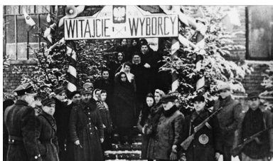
Wejście do lokalu wyborczego w Sanoku, 19 I 1947 r.

Według podanych oficjalnie do wiadomości wyników w wyborach wzięło udział blisko 90 proc. uprawnionych, spośród których na listę bloku zagłosować miało 80,1 proc., na PSL – 10,3 proc., na SP – 4,7 proc., na zorientowane na współpracę z komunistami grupy katolickie – 1,4 proc., a na PSL „Nowe Wyzwolenie” – 3,5 proc. W Sejmie Ustawodawczym znalazło się 114 przedstawicieli PPR i 116 PPS. SL uzyskało 109 mandatów, PSL – 27, PSL „Nowe Wyzwolenie” – 7, SD – 41, SP – 15, katolicy – 5, bezpartyjni – 10.