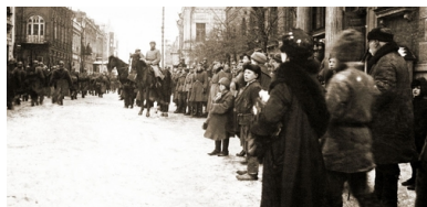
5 Pułk Piechoty Legionów Wojska Polskiego w Dyneburgu w styczniu 1920 r.