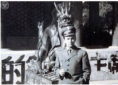
Ppłk Ryszard Kukliński w Pekinie, ok. 1967 r.

Po trwającym ponad dwa lata śledztwie, 13 marca 1984 r., Naczelna Prokuratura Wojskowa skierowała do Sądu Warszawskiego Okręgu Wojskowego akt oskarżenia. Obejmował on dwa generalne zarzuty tj. trwałe uchylanie się od służby wojskowej poprzez opuszczenie macierzystej jednostki i nielegalny wyjazd z kraju oraz działanie na rzecz wywiadu USA poprzez przekazywanie mu „informacji godzących w podstawy bezpieczeństwa i obronności PRL”. Prokuratura jednocześnie wniosła o rozpoznanie sprawy w trybie postępowania w stosunku do nieobecnych, z wyłączeniem jawności.