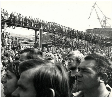
Pracownicy Stoczni Warszawskiej na wiecu, sierpień 1980 r.

W dużych zakładach pracy spotykało się większą różnorodność typów ludzkich, a środowisko zakładowe było znacząco mniej uładzone i podatne na indoktrynację niż inteligencja. Reprezentacja robotnicza kształtowała się według szczególnych reguł zarówno w czasie rewolty grudniowej z 1970 r. oraz strajku Bałuki ze stycznia 1971 r., jak i strajku sierpniowego 1980 r., podczas których o wyborze przywódców decydowały nie wykształcenie, zawód czy członkostwo w PZPR, ale szacunek wynikający z cech osobowości, wiarygodności i siły.