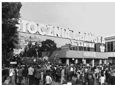
Druga brama Stoczni Gdańskiej im. Lenina w czasie strajku w sierpniu 1980 r.