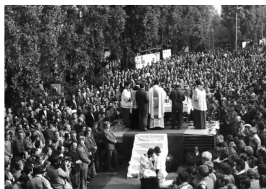
Msza św. w Stoczni Gdańskiej

Podczas trwających do końca strajku negocjacji (Komisja pod przewodnictwem Jagielskiego przybywała do gdańskiej Stoczni na rozmowy z MKS 23, 26, 28, 30 i 31 sierpnia) przedstawiciele władz dość szybko zaakceptowali większość postulatów, za wyjątkiem najważniejszego – utworzenia wolnych związków zawodowych. Jednak wobec nieustępliwej postawy strajkujących i rozszerzania się akcji protestacyjnej na cały kraj zdecydowali się ustąpić oraz zaakceptować powstanie niezależnych i samorządnych związków zawodowych. W prowadzeniu negocjacji ze stroną rządową przedstawicielom MKS pomagała powołana 24 sierpnia Komisja Ekspertów, której przewodniczył Tadeusz Mazowiecki. 38 Obok oficjalnych doradców byli także nieoficjalni – np. Lech Kaczyński, którego udział w sformułowaniu części punktów porozumienia był bardzo duży. 39