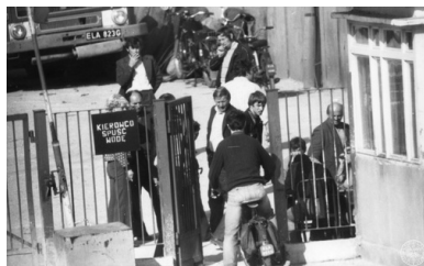
Brama Elbląskiego Przedsiębiorstwa Budownictwa Przemysłowego, 28 sierpnia 1980 r.