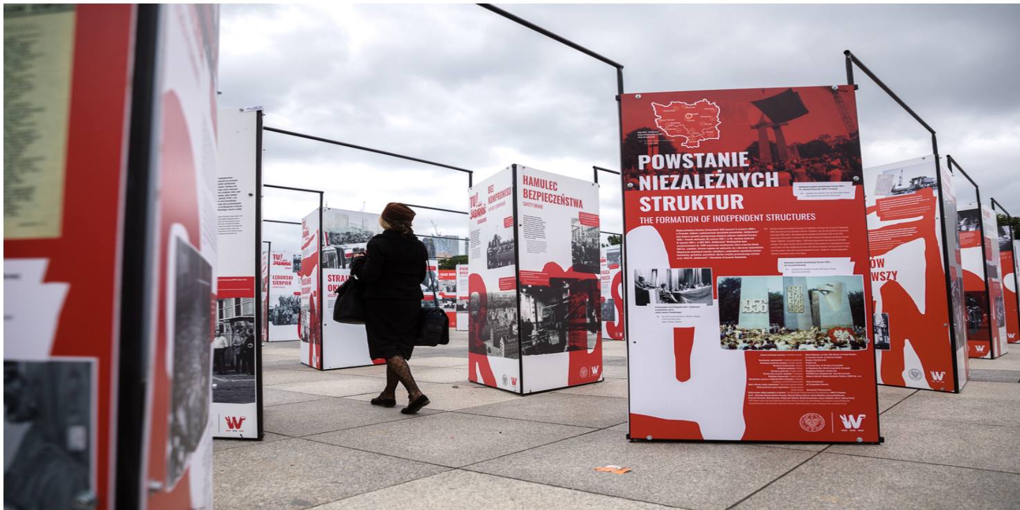
Wystawa IPN Tu rodziła się Solidarność na placu Piłsudskiego w Warszawie – 28 sierpnia 2020.

https://przystanekhistoria.pl/pa2/tematy/sierpien-1980/80137,NSZZ-quotSolidarnoscquot-Region-Zielona-Gora-wybrane-aspekty-dzialalnosci-w-lata.html