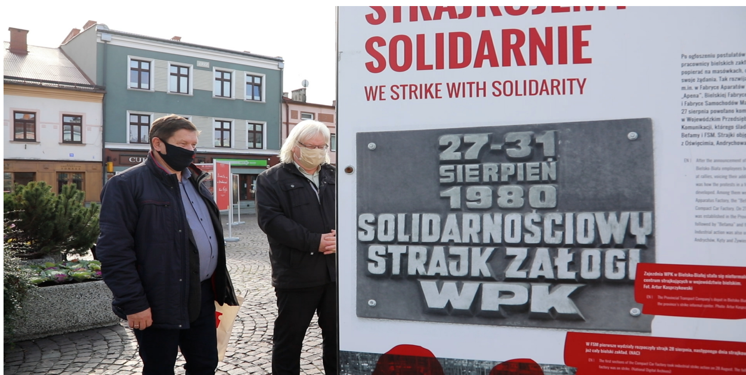
Otwarcie wystawy „Tu rodziła się Solidarność” w Skoczowie.

https://przystanekhistoria.pl/pa2/tematy/sierpien-1980/85736,Sierpien-80-na-Podbeskidziu.html