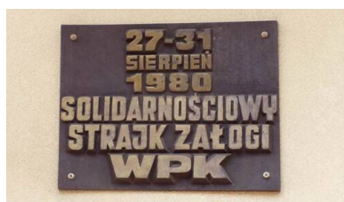
Tablica upamiętniająca strajk załogi WPK BB

W okresie gorącego lata 1980 roku na terenie województwa miały miejsce strajki. O ile te z lipca i pierwszych dni sierpnia udało się lokalnym władzom administracyjnym i partyjnym szybko wyciszyć stosując zasadę zaspakajania żądań ekonomicznych protestujących, to w drugiej połowie sierpnia 1980 roku już tak łatwo nie było. Skala strajków była już inna, a poza tym robotnicy widząc to, co się działo w kraju, a zwłaszcza na Wybrzeżu, już nie tylko podnosili postulaty płacowe, ale i solidaryzowali się z walką ich kolegów z Gdańska czy Szczecina.