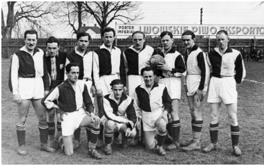
Drużyna piłkarska klubu sportowego Jutrzenka Lwów, 1935 r.

Inna legenda Cracovii, Józef Kałuża, w czasie II wojny światowej jako jeden z nielicznych członków zarządu PZPN pozostał w kraju. Ryzykując życiem, odrzucił wszystkie propozycje współpracy z niemieckimi władzami okupacyjnymi, np. objęcia stanowiska Sportführera w Generalnym Gubernatorstwie.