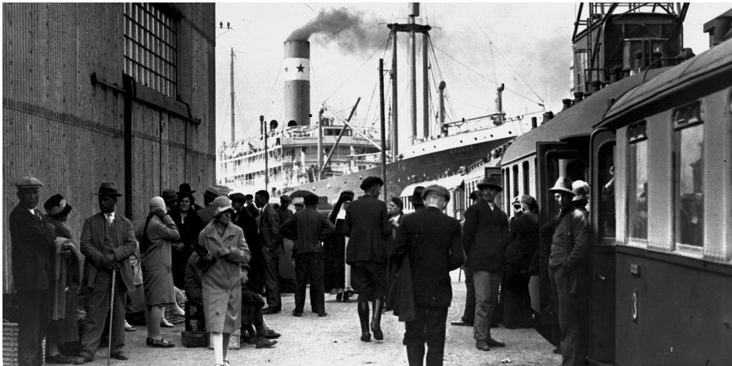
Pasażerowie na peronie kolejowym w porcie w Gdyni, lata trzydzieste.

https://przystanekhistoria.pl/pa2/tematy/statki-i-okrety/96865,Burzliwe-dzieje-lokalizacji-portu-morskiego-Na-stulecie-portu-w-Gdyni.html