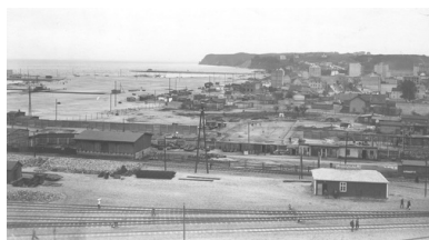
Budowa portu morskiego w Gdyni, 1929 r.

Reasumując powyższe widzimy, że rząd: 1) zbadał istniejący port w Gdańsku, 2) wykazał możliwość założenia portu w Tczewie i 3) wybrał miejsce pod budowę portu w Gdyni”.