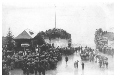
„Zaślubiny Polski z morzem” w Zatoce Puckiej, 10 lutego 1920 r.