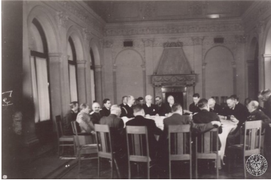
Przedstawiciele Stanów Zjednoczonych, Wielkiej Brytanii i Związku Sowieckiego podczas jednego z posiedzeń konferencji w Jałcie, luty 1945 r.

po stronie polskiej Lwowa i borysławskiego zagłębia naftowego). Na zachodzie przypaść miały Polsce Prusy Wschodnie, jednak bez Królewca, Gdańsk i cały Górny Śląsk. Pomorze Zachodnie i Dolny Śląsk stanowić miały przedmiot przetargu – ziemię tę, jako rekompensatę, ofiarowywał Polsce Stalin, który przyobiecał Bierutowi i Osóbce-Morawskiemu, że zachodnia granica Polski biec będzie wzdłuż Odry i Nysy Łużyckiej od Szczecina aż po terytorium Czechosłowacji.