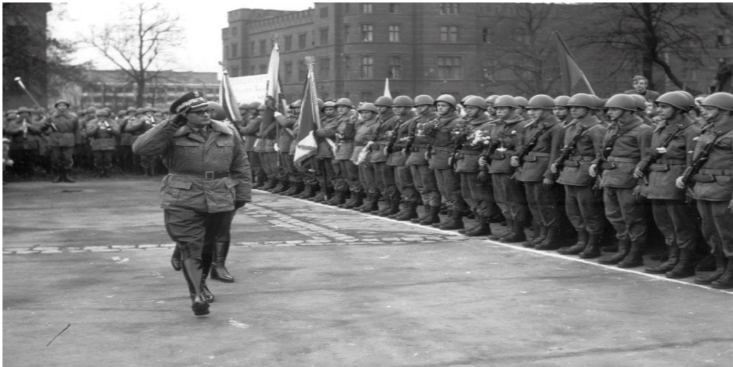
Gen. Florian Siwicki przed frontem żołnierzy wracających z CSRS, Wrocław, 4 listopada 1968 r.

https://przystanekhistoria.pl/pa2/tematy/uklad-warszawski/81439,Udzial-PRL-w-inwazji-na-Czechoslowacje.htm