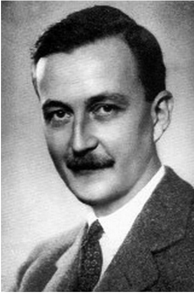
János Esterházy (1901-1957).