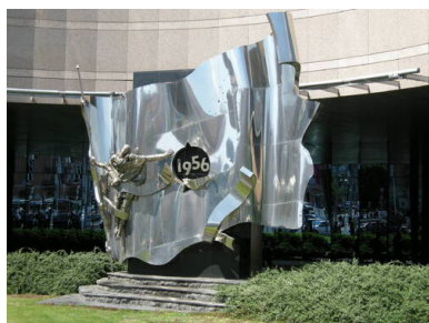
Pomnik Rewolucji Węgierskiej 1956 autorstwa Gézy Bakosa i

Z okazji skorzystało dwóch reporterów Radia Kossuth.