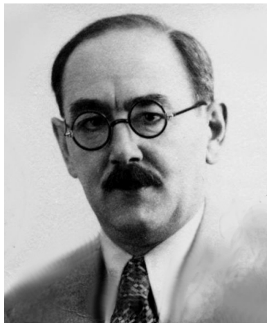
Imre Nagy.

WSPR zdoła stać się siłą reformatorską bez wewnętrznego rozłamu – nie jako przeszkoda i struktura nadająca się do likwidacji, ale jako uczestnik procesu przekształcania systemu.