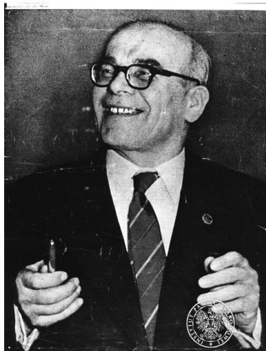
Władysław Gomułka, październik 1956. Fotokopia najprawdopodobniej dziesiątej strony z tygodnika „Świat” zawierającego artykuł Trzy dni, które wstrząsnęły Polską, z numeru z października 1956 r.

„liberalizacji” i jednocześnie granicę, której przekroczenie czyniło realnym groźbę „bratniej” interwencji.