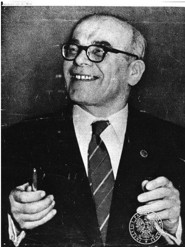
Władysław Gomułka, październik 1956. Fotokopia najprawdopodobniej dziesiątej

„to przekreślanie niepodległości naszego kraju, to skreślanie Polski z mapy państw europejskich”.