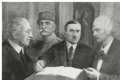
Prezydent Woodrow Wilson, marszałek Ferdinand Foch, Roman Dmowski i Ignacy Paderewski, obraz olejny Kazimierza Szmyta Podpisanie układu wersalskiego , 1923 r.

U progu lata 1918 r. z perspektywy Zachodu problemem takim pozostawały Niemcy – środkowoeuropejskie mocarstwo, wyczerpane wojną, ale dzięki utrzymywaniu panowania nad rozległymi obszarami Europy środkowej oraz wschodniej dysponujące możliwościami szybkiej odbudowy sił. Problemem była także formująca się bolszewicka Rosja. Obawy przed nimi sprawiły, że głos aktywnych na Zachodzie polskich polityków, wskazujących korzyści, jakie z zachodniej perspektywy oznaczać będzie powrót Polski na mapę, został w końcu wysłuchany. W kolejnym miesiącu, po załamaniu się ostatecznie z niemieckich ofensyw, alianci uzyskali przewagę, którą utrzymali aż do załamania się niemieckiego oporu 11 listopada. Sprawa polska, pozbawiona szans przez cały wiek XIX, stanęła w obliczu koniunktury, perfekcyjnie wyzyskanej w decydujących miesiącach przełomu 1918 i 1919 roku. Symbolem tych wysiłków stał się 11 listopada 1918 r., oznaczający z polskiej perspektywy upadek ostatecznego zaborcy. Ale początkiem drogi, a i zapowiedzią jej kierunku był 3 czerwca 1918 r. - dzień ogłoszenia deklaracji wersalskiej.