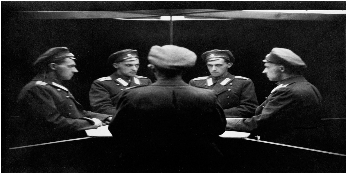
Stanisław Ignacy Witkiewicz, Autoportret wielokrotny w lustrach , 1915–1917.

https://przystanekhistoria.pl/pa2/tematy/wrzesien-1939/43399,Witkacy-swiadek-poczatku-i-konca-niepodleglosci.html