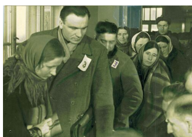
Kolejka w lokalu wyborczym, 19 I 1947 r.