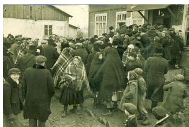
Mieszkańcy wsi przed lokalem wyborczym, 19 I 1947 r.