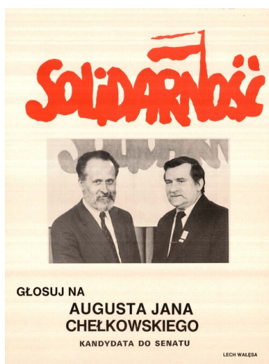
Wybory czerwcowe 1989 r. Plakat

Trudną do przecenienia rolę w kampanii odegrały rozrzucone w postaci ulotek instrukcje wyborcze. Najskuteczniejsze okazały się tzw. ściągki, na których umieszczono szczegółową informację na kogo głosować, a kogo skreślić (na większości z nich zapisano tylko nazwiska kandydatów KO na senatorów oraz na posłów w poszczególnych okręgach, wraz z zaleceniem, by pozostałe osoby wykreślić). Ulotki tego typu zaczęto rozrzucać już pod koniec kwietnia.