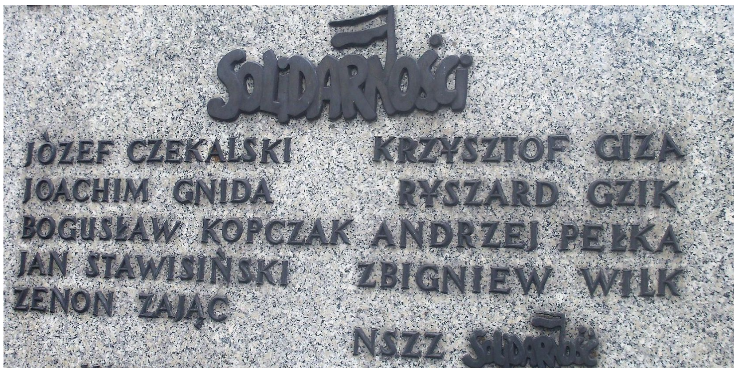
Polegli w Wujku

https://przystanekhistoria.pl/pa2/tematy/zbrodnie-komunistyczne/61857,Za-mlody-zeby-umrzec.html