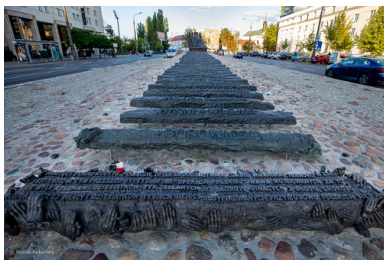
Warszawski pomnik "Poległym i Pomordowanym na Wschodzie", pod którym odbywają się uroczystości poświęcone ofiarom "operacji polskiej NKWD"

Kiedy to zostanie zbadane na pewnym poziomie, np. niewielkiego obwodu, powiedzmy wołogodzkiego, wtedy dowiemy się, w jaki sposób przebiegała tam operacja. Ale to nie znaczy, że w obwodzie wołogodzkiem przebiegała ona tak samo jak w Gruzji. W każdym regionie wyglądało to inaczej. Jednym słowem, trzeba zrozumieć, że „polski rozkaz” objął w istocie całą „międzynarodówkę” ludzi zamieszkujących ZSRS, chociaż na pierwszym miejscu niezaprzeczalnie byli Polacy.