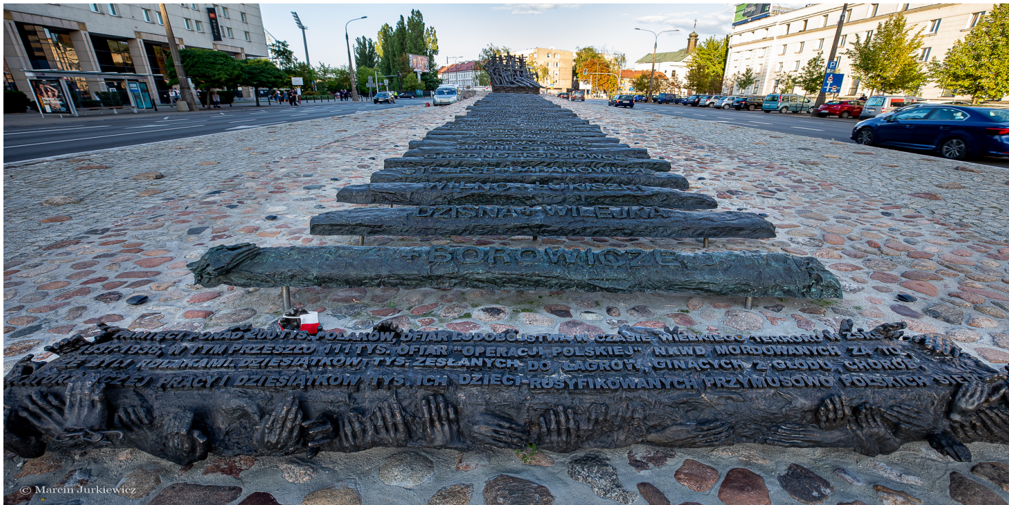
Warszawski pomnik "Poległym i Pomordowanym na Wschodzie", pod którym odbywają się uroczystości poświęcone ofiarom "operacji polskiej NKWD"

https://przystanekhistoria.pl/pa2/tematy/zbrodnie-komunistyczne/62667,Operacja-polska-1937-1938-na-tle-mechanizmow-Wielkiego-Terroru.html