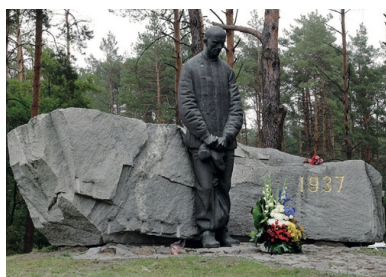
Pomnik poświęcony ofiarom represji sowieckich z 1937 w Bykowni k. Kijowa.

NP: Tak. A z kogo przede wszystkim składała się każda armia? Z chłopów i robotników. Co więcej, doskonale wiemy, że spośród wszystkich partii komunistycznych działających w Moskwie Stalin rozwiązał tylko partię polską. Inne represjonował, „czyścił”, ale polską zlikwidował całkowicie. Członkowie Komunistycznej Partii Polski, w jego ocenie, byli najbardziej niebezpieczni, „zakażeni” kontaktami z obcymi służbami wywiadowczymi.