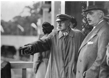
Marszałek Józef Piłsudski z Januszem Radziwiłłem na trybunie honorowej podczas VII Oficjalnych Międzynarodowych Zawodów Konnych w Warszawie, czerwiec 1934 r.