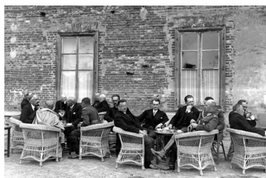
Prezydent RP Ignacy Mościcki z