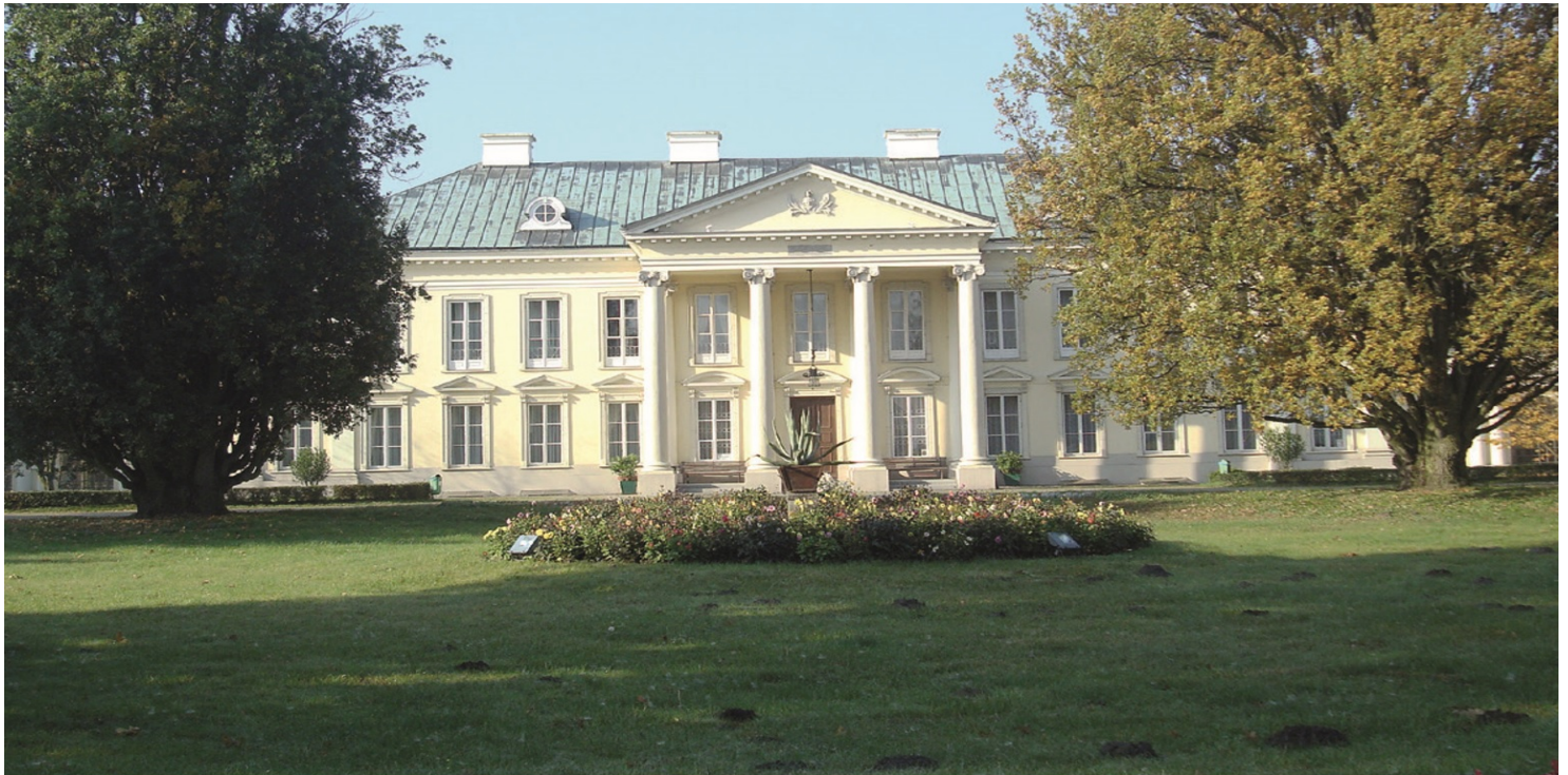
Pałac w Walewicach.

https://przystanekhistoria.pl/pa2/tematy/ziemianstwo/106137,Blekitna-szesnastka.html