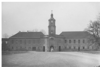
Zamek Radziwiłłów w Ołyce w okresie międzywojennym. Fot. ze zbiorów NAC

W II Rzeczypospolitej był znaczącą figurą. Przez wiele lat pełnił funkcję przewodniczącego Komisji Spraw Zagranicznych Sejmu, a później zasiadał w Komisji Spraw Zagranicznych Senatu. Nie zawsze zgadzał się z oficjalnym kierunkiem polityki zagranicznej, krytykował m.in. stanowisko ministra Józefa Becka wobec Czechosłowacji w 1938 r. 6 .