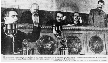
Od lewej Trofim Łysenko, Stanisław Kosior, Anastas Mikojan, Andriej Andriejew, Józef Stalin. Kreml, Pałac Zjazdów 1935

W okresie późniejszym Kosior był jednym z organizatorów KP(b) Ukrainy. W latach 1928–1938 stał na jej czele, odgrywał ważną rolę w kampanii głodzenia ludności w latach 1932–1933 oraz w Wielkim Terrorze lat 1937–1938. W 1930 r. został członkiem Politbiura, a w styczniu 1938 r. wiceprzewodniczącym Rady Komisarzy Ludowych ZSRS oraz przewodniczącym Komisji Kontroli Państwowej. W związku z tym miał okazję podpisać pięć stalinowskich list egzekucyjnych. Kosiora aresztowano 3 maja 1938 r. pod fikcyjnym zarzutem przynależności do Polskiej Organizacji Wojskowej (POW). Został rozstrzelany 26 lutego 1939 r. 6