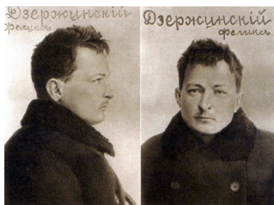
Feliks Dzierżyński, akta Ochrany,

Postanowiłem przyrzeć się porewolucyjnym losom kilkunastu znanych Polaków, którzy brali udział w rewolucji październikowej w Piotrogradzie. Lista nie jest pełna – to wyłącznie ci, o których udało mi się znaleźć informacje.