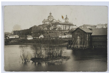
Berdyczów, kościół p. w. Niepokalanego Poczęcia NMP i klasztor karmelitów bosych. Fotografia pocztówki, około 1918.